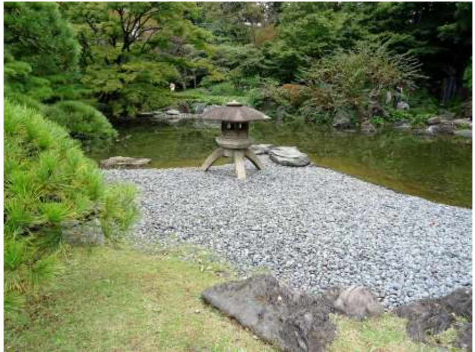
Japan, zoals in de folder