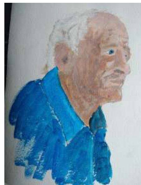
oude man wacht

In de komende twintig jaar verschuift het evenwicht tussen werkenden en zorgafhankelijken sterk. Er moet veel meer zorg verleend gaan worden. De ouderen vangen dat deels samen op, maar de mogelijkheden van steeds ouder wordende mensen zijn beperkt. De huidige zorgverlening lijkt niet in staat de nodige extra zorg te bieden. Versnippering, regelgeving en marktwerking zitten een doelmatige en doeltreffende ouderenzorg in de weg. Technologie kan wel helpen, maar lijkt ook niet de ultieme oplossing. De overheid is aan zet. Wet en regelgeving, centrale sturing vanuit een deskundige en compassievolle overheid, financiering onder gunstige voorwaarden, dienstplicht, inzet arbeidsmigranten. Je moet maar durven.