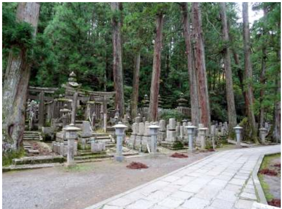
Okunoin, de dodenstad

wijzen. Dat kan hij helaas niet. Het duurt even voor ik hem kan afschudden en dan is Marian verdwenen. Het is de eerste keer dat we elkaar kwijt zijn. Op de laatste dag! Na een uurtje rondhangen in het station zoek ik ons hotel op en vertrouw erop dat Marian zal opduiken. Dat doet ze na een paar uur inderdaad. De opluchting is groot. De volgende dag moeten we tijdig naar het vliegveld. We kunnen voor het eerst onze trein niet vinden en het stationspersoneel wijst ons een trein waar weliswaar Airport op staat, maar die we niet vertrouwen. Er zitten geen toeristen in, er zijn geen koffers. Onze medereizigers zwijgen op mijn vragen. De redding komt van twee heel behulpzame Japanse jonge vrouwen, die heel vaardig zijn met hun mobieltjes. We moeten verderop overstappen op een andere lijn. We moeten om half negen op het vliegveld zijn. We zijn er even voor negenen. Eenmaal in het vliegtuig valt een last van ons af. Over elf uur en veertig minuten zijn we in Amsterdam. Dan nog met de trein naar Wezep. Want hoewel de kinderen ons graag wilden halen begrepen ze ook wel: deze reis moest eindigen zoals hij begonnen was: per trein. Samen.