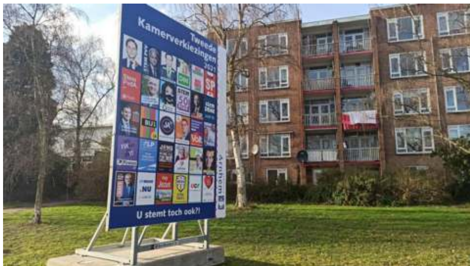
Verkiezingsbord in Arnhem Omroep Gelderland

Ja, het pensioenstelsel is complex en voor veel jongeren een 'ver van mijn bed show'. Maar om in de verkiezingstijd helemaal geen of alleen in vage termen aandacht aan dit voor zeer veel mensen belangrijke onderwerp te besteden, doet onrecht