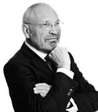
en gaande man

"Omdat ik van nature iemand ben, die graag mensen met elkaar verbindt, in plaats van tegen elkaar opzet, ben ik verder gegaan op het pad van de samenwerking met de andere landelijk seniorenorganisaties, de ANBO, KBO-PCOB en NOOM. Want 'met elkaar' werkt nu eenmaal beter dan tegen elkaar. Die mogelijkheid ontstond, omdat ook daar nieuwe mensen aantraden die dezelfde opvatting bleken te hebben. Met de senioren van