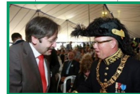
GOUVERNEUR THEO BOVENS EN OLS FEDERATIE PRESIDENT GER KOOPMANS

schuttersfestijn in Limburg. Dit jaar vond dit plaats op 2 juli in Merkelbeek. Dit kun je winnen om met een zestal te schieten op een rek met 18 punten. (zie foto).