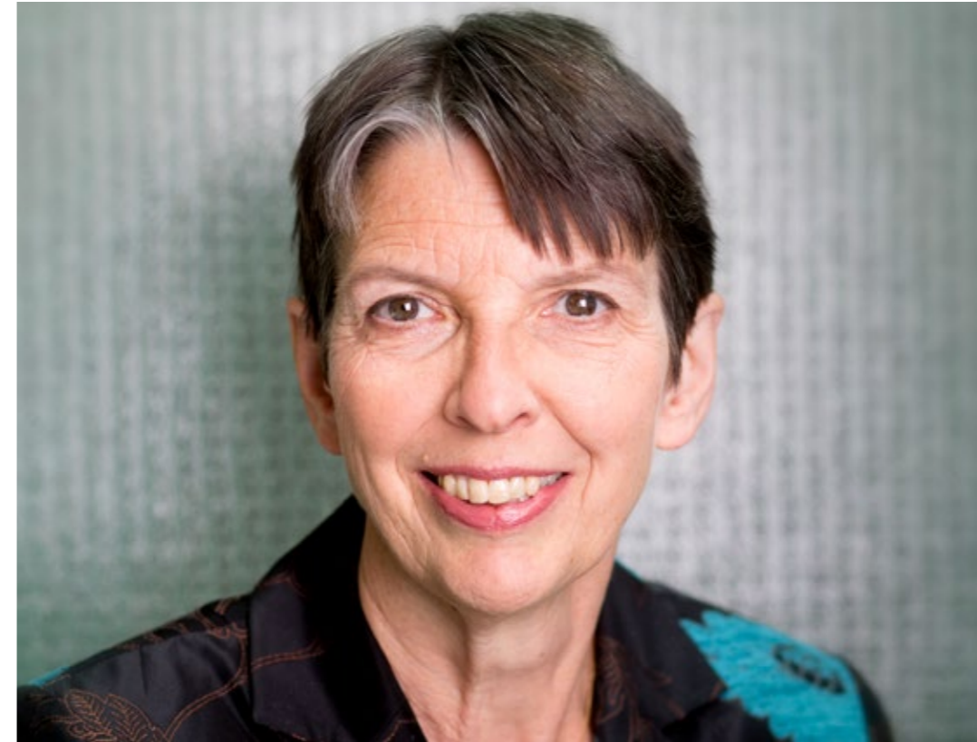
Staatssecretaris Jetta Klijnsma

Wat ik ook merk tijdens al die gesprekken is, dat ouderen over het algemeen tevreden zijn met wat ze hebben. We zien in zoveel landen om ons heen dat het allemaal ook veel slechter kan zijn. Dat ontslaat ons natuurlijk niet van de verplichting om in Nederland ons best te blijven doen om vooral de mensen die het niet makkelijk hebben, te helpen. Daarom heeft het kabinet vorig jaar ruim 1 miljard