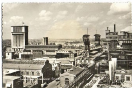
Staatsmijn Emma, Hoensbroek