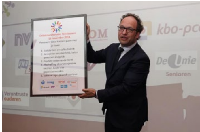
Minister Koolmees heeft zojuist het 'Kader voor een nieuw pensioenstelsel' aangeboden gekregen.