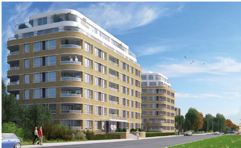
Woonzorgcentrum ZeeWinde in Scheveningen

Zo doet ze ook nieuwe contacten op. "Ik woon op de vijfde verdieping en ik heb een meneer ontmoet van de zevende wiens vrouw is overleden. Wij houden elkaar gezelschap en gaan vaak samen koffiedrinken en eten. De tafels zijn hier gedekt voor vier personen, dus er schuiven dan nog twee mensen aan. Dat is altijd leuk. Mensen gaan hier heel gemakkelijk met elkaar om. Ik ken eigenlijk iedereen die hier woont.